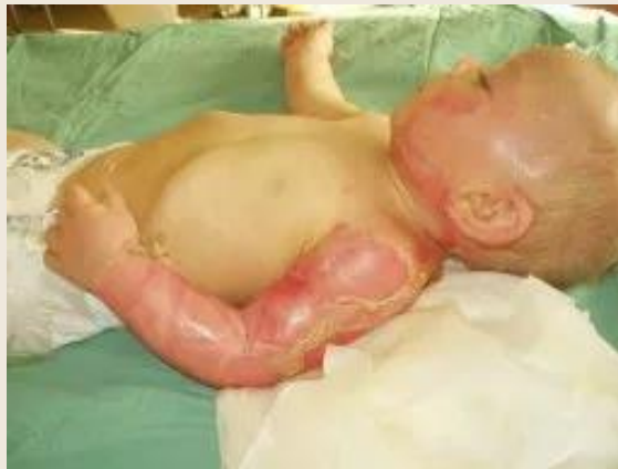
opaření horkou vodou