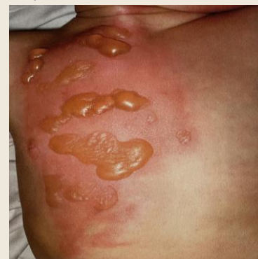
Opaření s tvorbou puchýřů (bul)