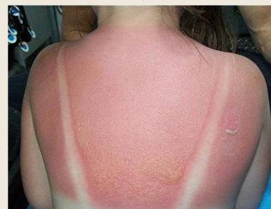
Popálení od sluníčka