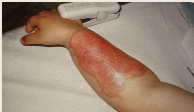
Opaření od horkého omastku