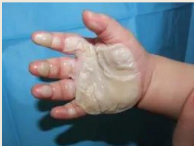
popálení o krb