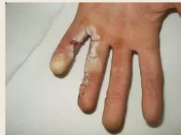
popálení proudem 220 V